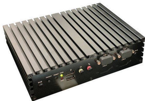
Gateway PC Computador de Enlace