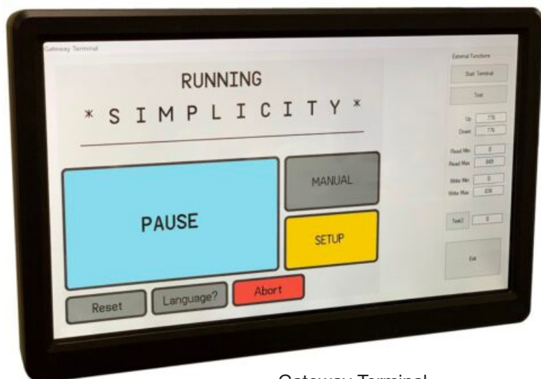
Gateway Terminal Terminal de Enlace

Images may include options. Las imágenes pueden incluir opciones.