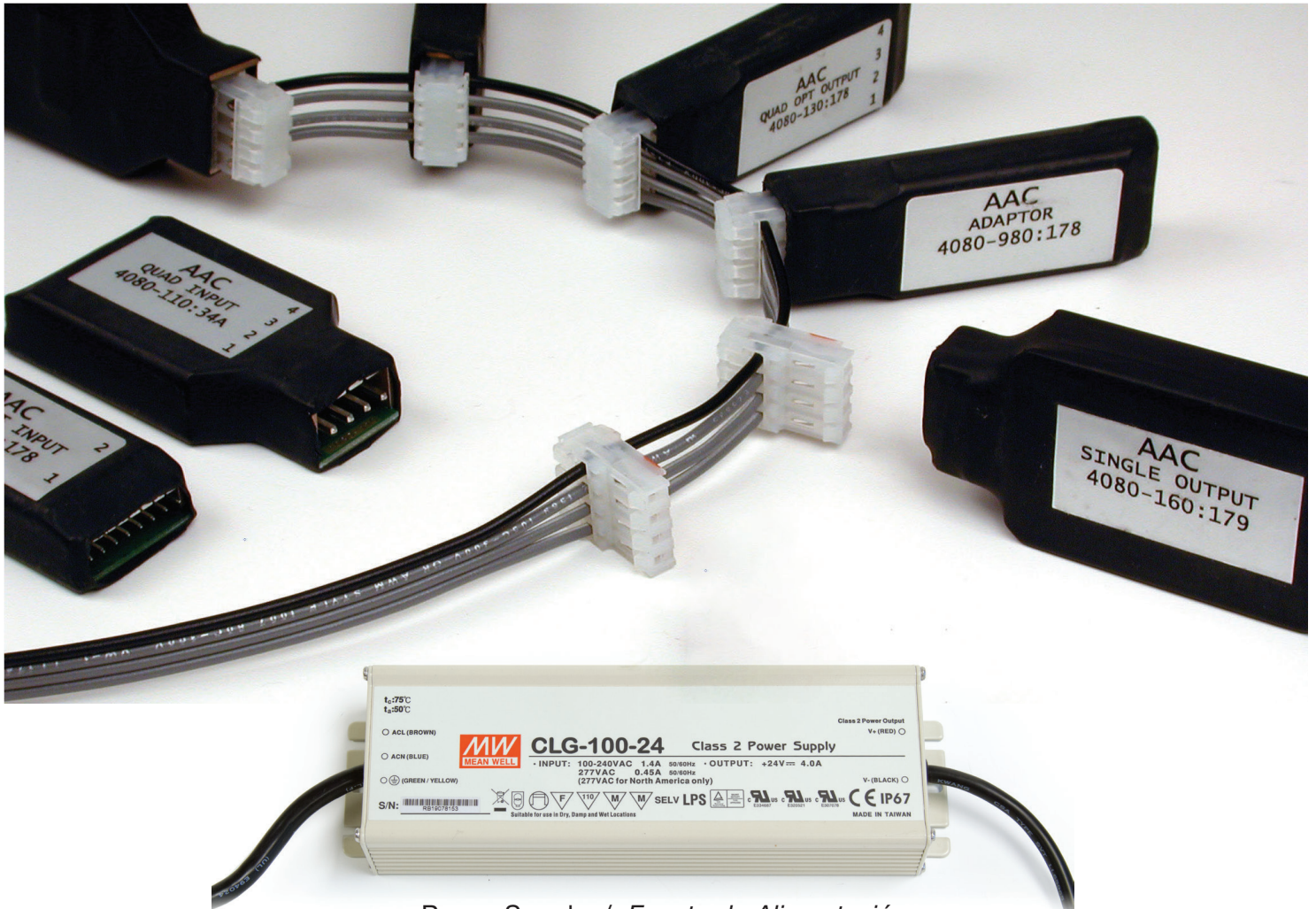
Power Supply / Fuente de Alimentación