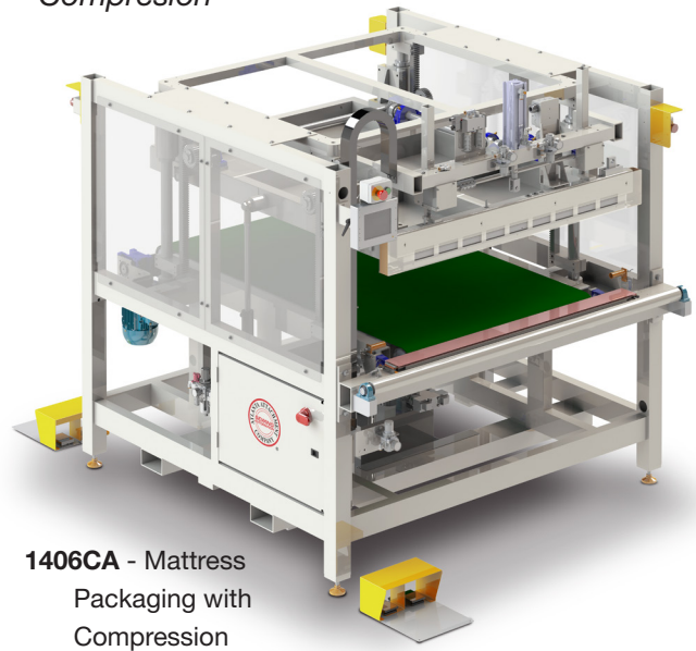
1406CA - Mattress Packaging with Compression