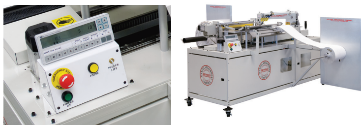
1366-24 with V820 Controls / con Controles V820