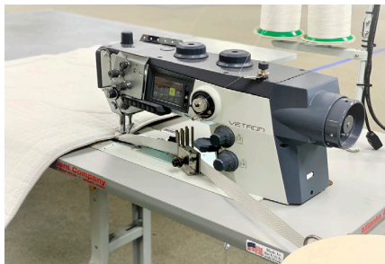
11344WV4 - Lockstitch