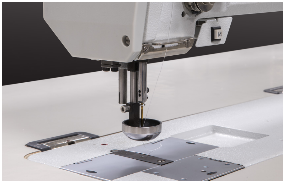
Spoon or eyelet style presser foot / Pie prensatelas estilo cuchara o ojal