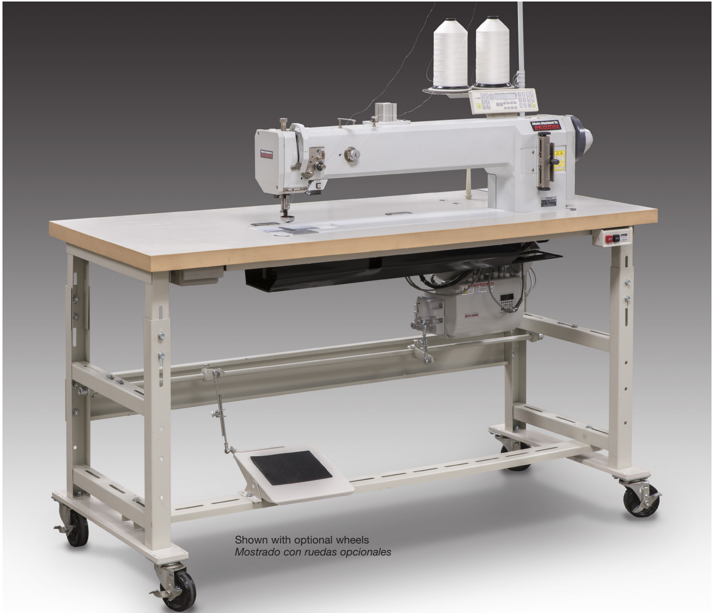
Shown with optional wheels Mostrado con ruedas opcionales

Images may include options. Las imágenes pueden incluir opciones.