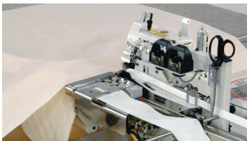
11339SAJ27 with single air table Con mesa simple de flotación neumática