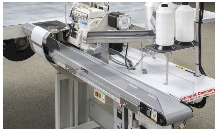
Optional 1337930 Waste Removal Conveyor Opcional 1337930 Transportador de residuos