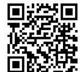
www.atlatt.com More Info Más Información