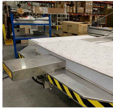
1315R-KIT03 Push Plate Assembly Empujador de colchon