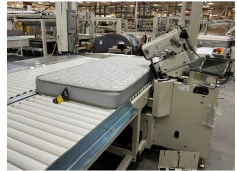
11315RP: Auto Tape edge with Pfaff Sewing Head Maquina encintadora Automatica con cabezal Pfaff