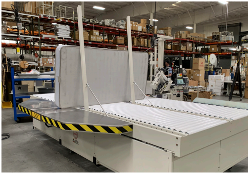
1315R-KIT01 Mattress flip Kit Head Volteador de colchones