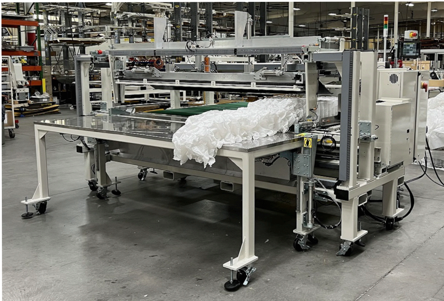
1/8 Narrow Scale version / Versión escala 1/8

Images may include options. Las imágenes pueden incluir opciones.