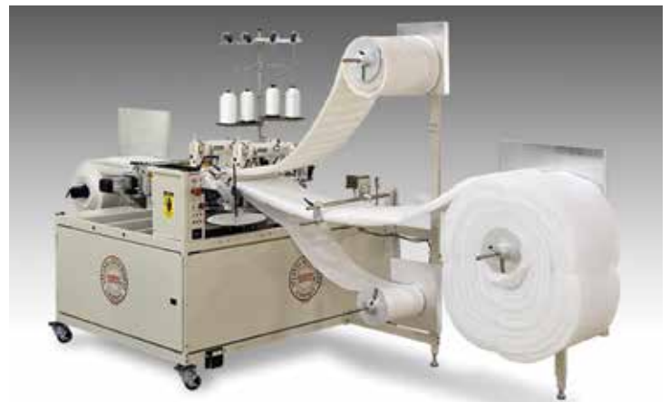
1961-KIT6B - Triple roll holder option Triple sujetador de rollos