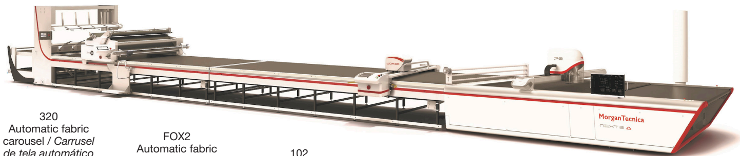
320 Automatic fabric carousel / Carrusel de tela automático