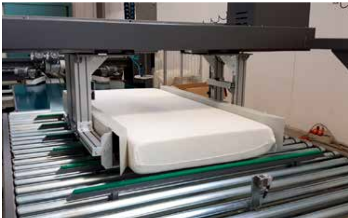
First Step: Automatic Measure Width and Length Primer paso: Mide automáticamente ancho y largo