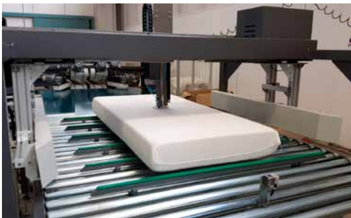
Second Step: Automatic Measure Height and Density. Segundo paso: Mide automáticamente altura y densidad.