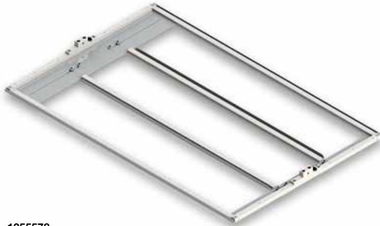
1355578 Clamp Frame Adjustable Assembly Conjunto Ajustable de Marco de Abrazadera

• 113551-1 - Estación de Trabajo de Borde Decorativo de una Cabeza