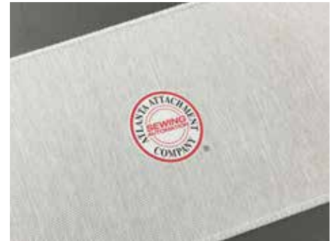
33210 - Automatic sew & miter corner workstation Estación de trabajo automática para esquinas y esquinas