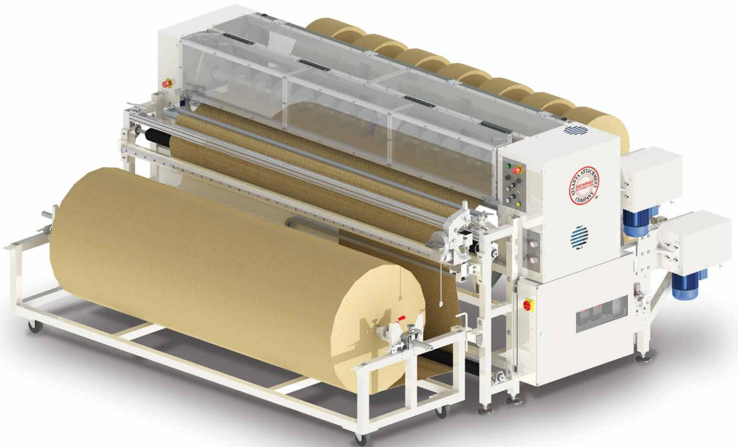
1393SBS with optional bag closer and duplex winder 1393SBS Con cerrador de bolsa opcional y doble enrollador

Images may include options. Las imágenes pueden incluir opciones.