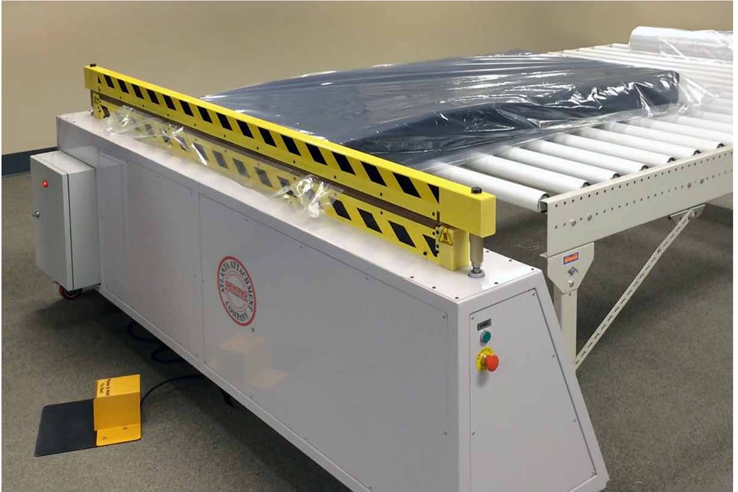
LSC2005 Conveyor table not included LSC2005 Mesa de rodillos no incluido

Images may include options. Las imágenes pueden incluir opciones.