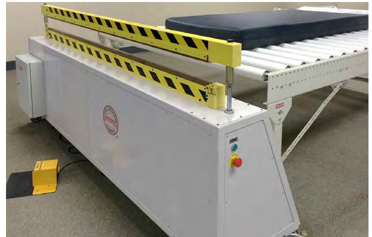
Dual E-Stops / Parada de Emergencia Dual