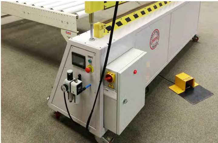
PLC Controls / Controles PLC