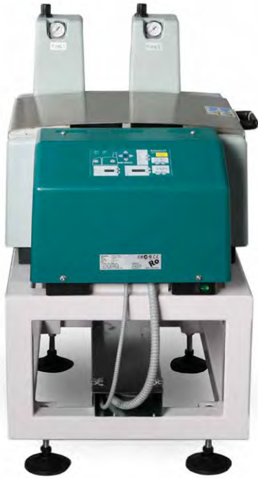
Hot melt gluing tank Tanque de pegamento caliente