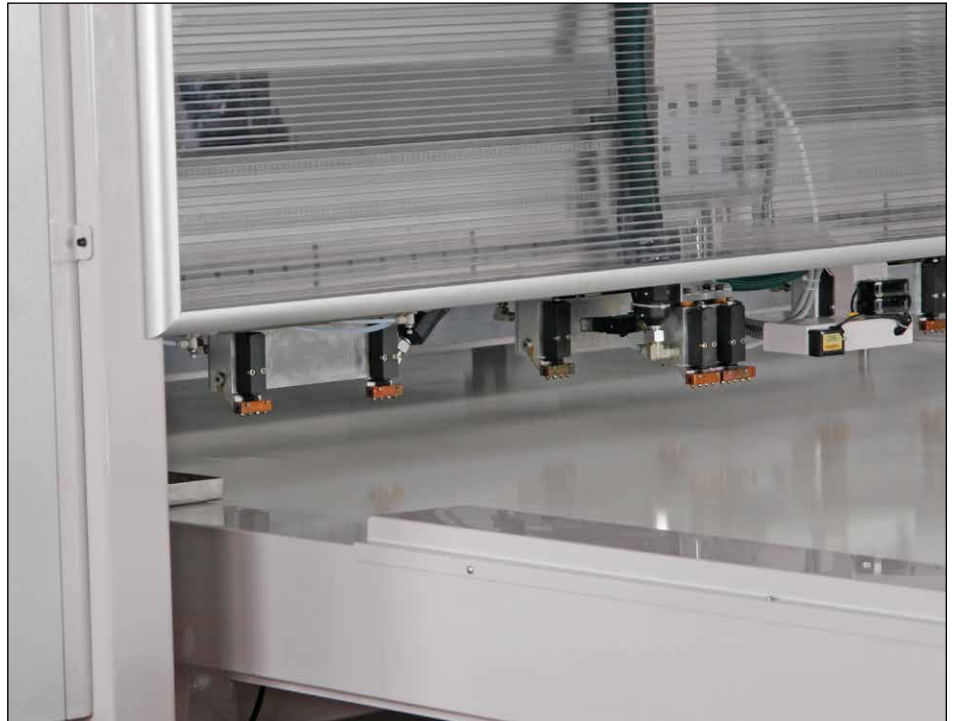
Hot melt nozzles Tanque de pegamento caliente