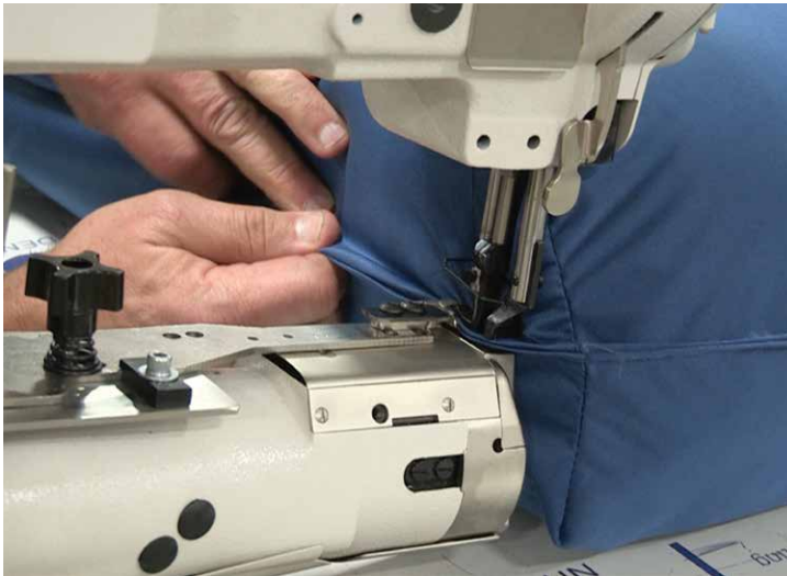
Sewing head horizontal for taping in middle of mattress Cabezal de costura horizontal para ribetear en el centro del colchón