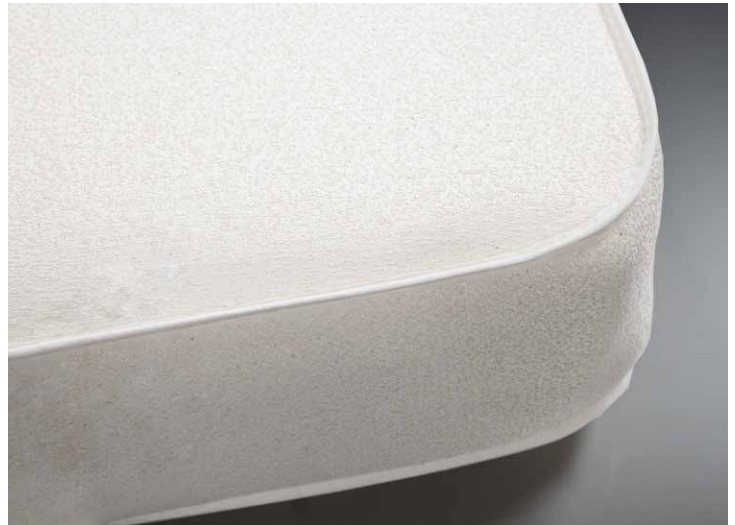
Sewing head tilted for taping top edge of mattress. Cabezal de costura inclinado para ribetear el borde superior del colchón