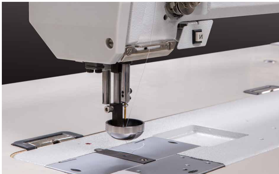
Spoon or eyelet style presser foot