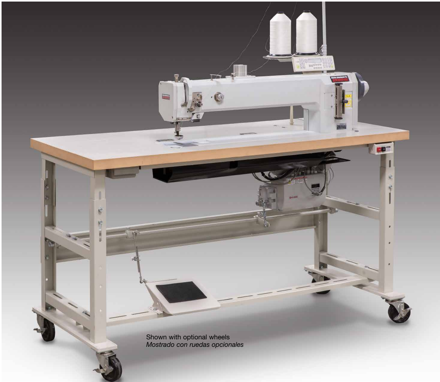
Shown with optional wheels Mostrado con ruedas opcionales

Images may include options. Las imágenes pueden incluir opciones.