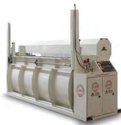
Spring Unbaler Desenrollador de Cilindros de Muelles