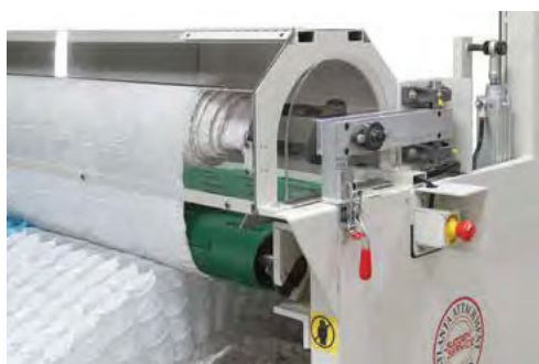
Wrap Accumulator Acumulador de Desperdicios