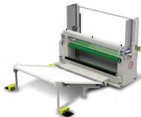
11409IC Optional Ramp Conveyor 11409IC Transportador de Rampa Opcional