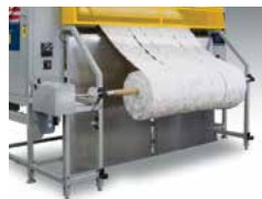
Table retracted, Border Slitter/Rewinder Mesa de cortador de tapa contraída, Cortadora / Rebobinado de los bordes

Panel cutter table lifts and retracts by touch screen. Mesa de cortar las Tapas se levanta y contrae por la pantalla táctil