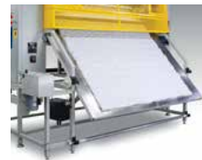
Table lifted, Panel Cutter Rewind bar stored on lower holder. Mesa de cortador de tapa extendida. Barra del rebobinado es almacenada en un soporte inferior.

Table retracted, Border Slitter/Rewinder Mesa de cortador de tapa contraída, Cortadora / Rebobinado de los bordes