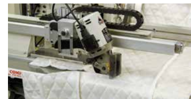
1335M-520A option Rotary knife assembly Cuchilla de corte circular