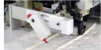
3200PM option Automatic Marking Module Marks border for placement of handles Módulo de marcado automático para el posicionamiento de las asas